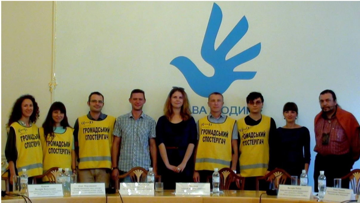
*Волонтери ОЗОН, вересень 2013 р., офіс Уповноваженої з прав людини

Група громадського спостереження «ОЗОН» протягом 2013 року проводила моніторинг більше ніж 80 мирних зібрань по всій Україні та оголосила своєю метою громадянський моніторинг та контроль за реалізацією права на мирні зібрання в Україні ( https://www.facebook.com/OZON.monitoring ).