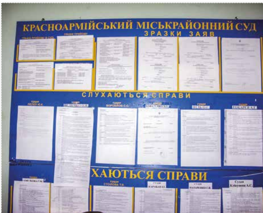
З АРХІВІВ МОБІЛЬНИХ МОНІТОРИНГОВИХ ГРУП ЦГС

Копії рішень та інших процесуальних документів видаються лише для тих справ, що були вивезені до Красноармійського районного суду. Для інших справ копії рішень та інших процесуальних документів видаються лише через процедуру відновлення втраченого провадження.