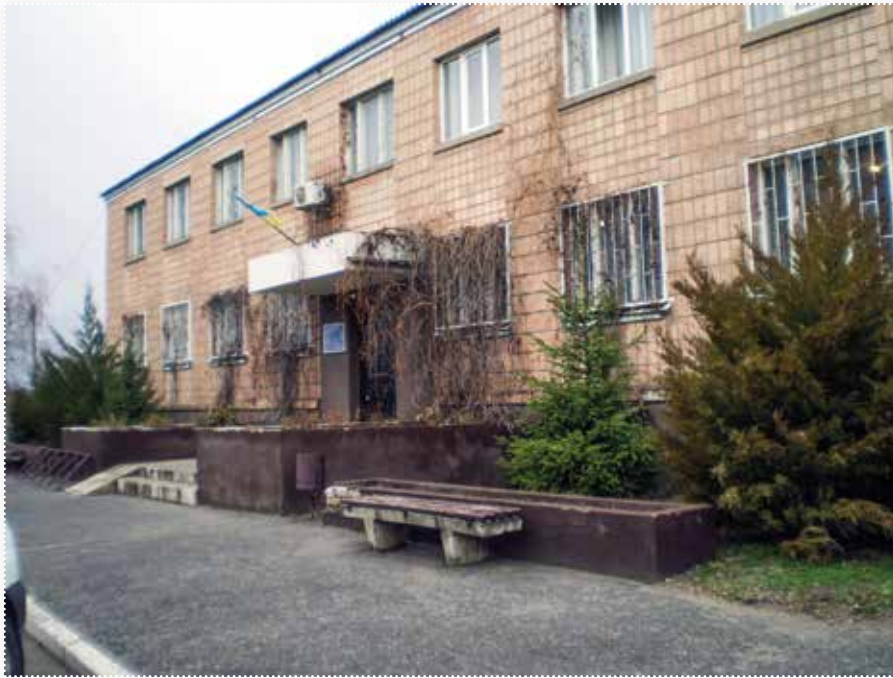
Новоайдарівський районний суд