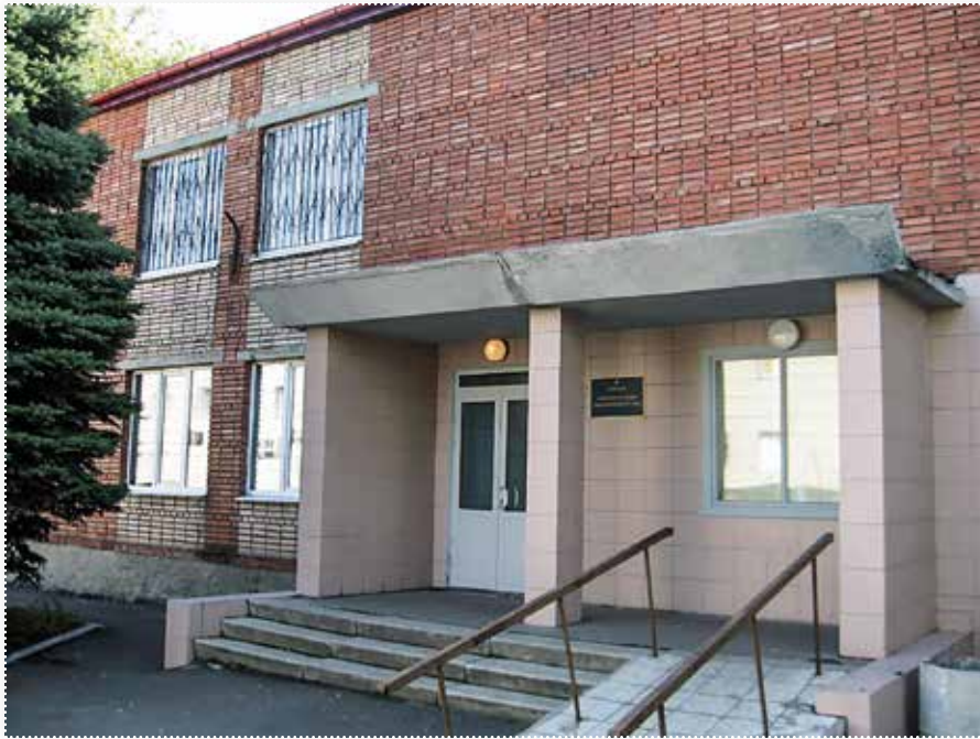
Добропільський районний суд

Д о Добропільського районного суду перенесено розгляд справ Авдіївського міського суду та Харцизького міського суду Донецької області.