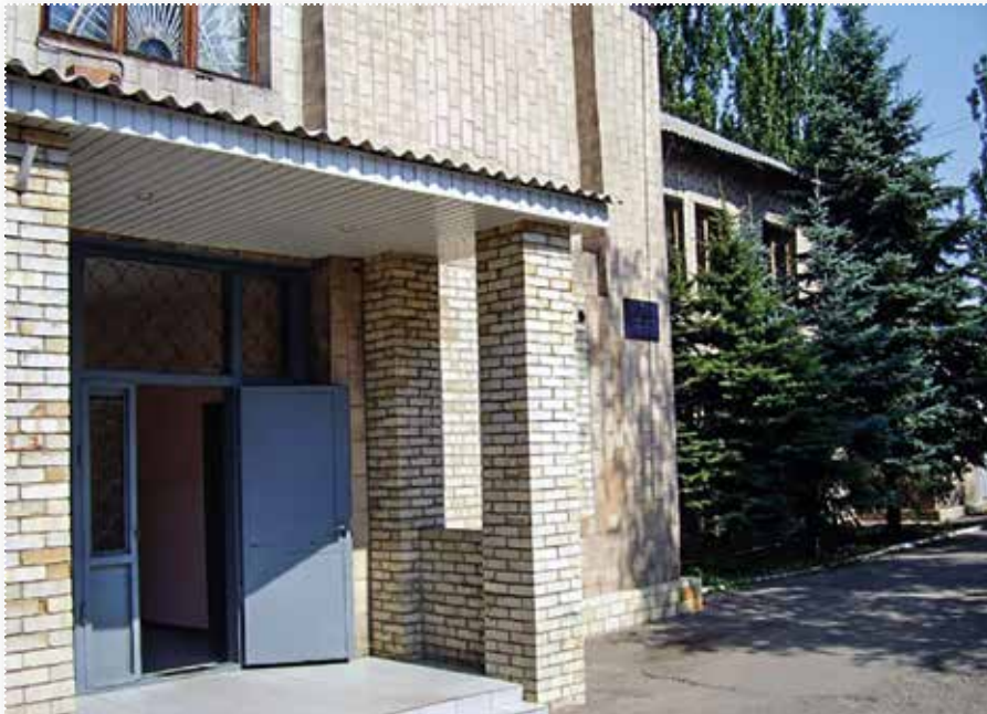
Дзержинський міський суд

Д зержинський міський суд, за розпорядженням голови вищого спеціалізованого суду, обслуговує території Пролетарського та Ленінського районів м. Донецька.