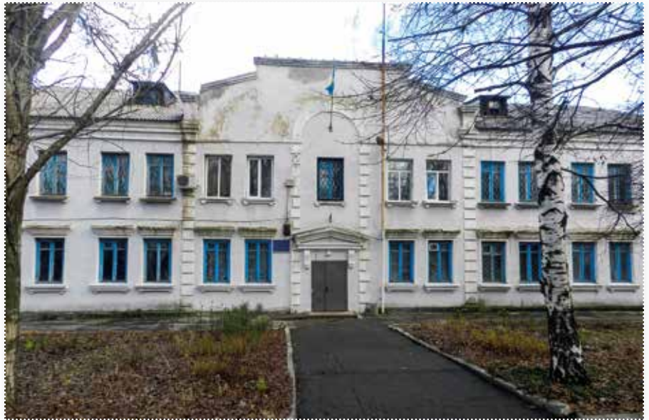
Попаснянський районний суд

Щоб вирішити питання з доставкою обвинувачених, у суді сформувалася практика, розгляду справ у режимі відеоконференції за згоди особи. Але є і такі справи, де особи відмовляються від відеоконференцій.