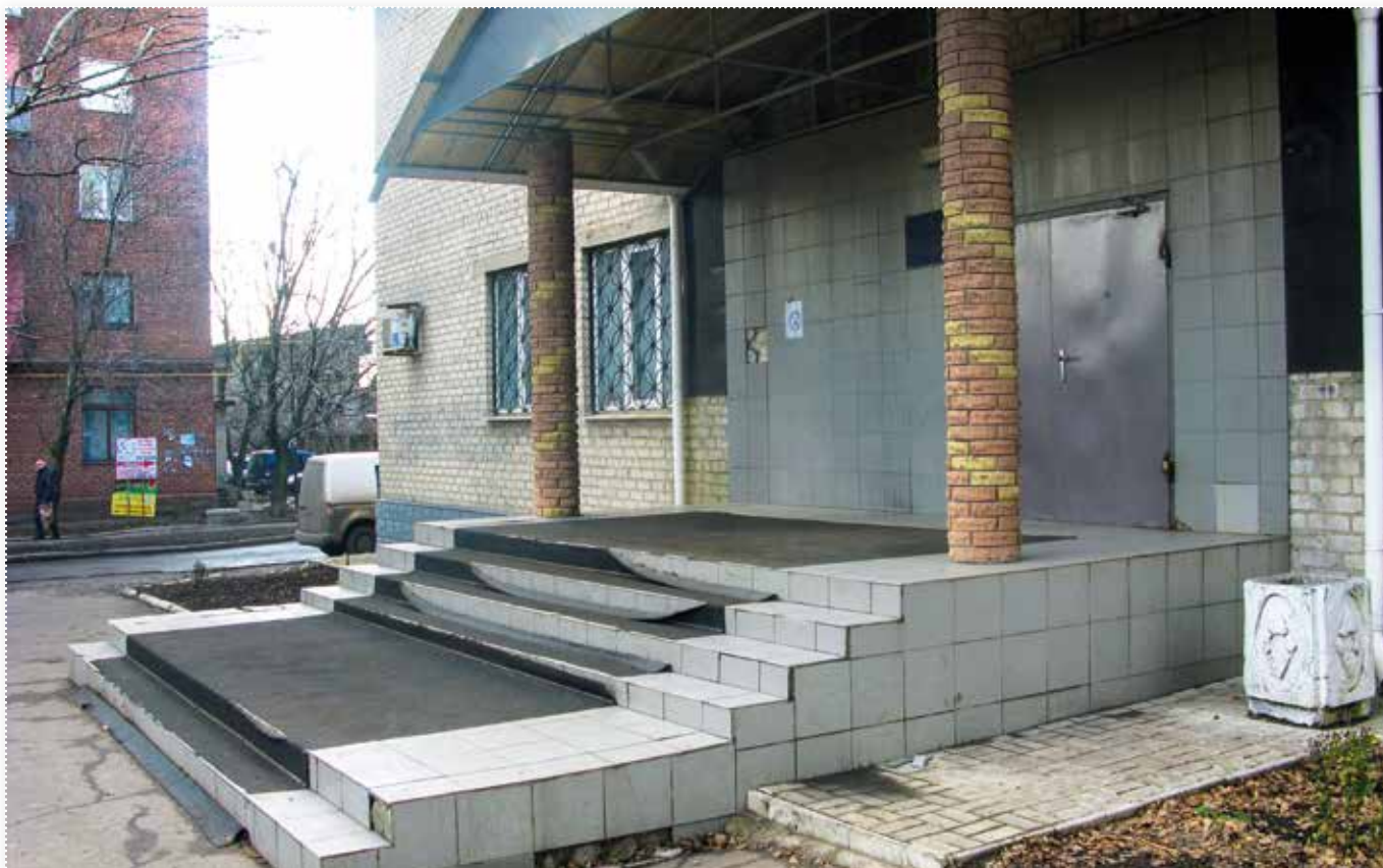
Красноармійський міськрайонний суд

У цей суд Красноармійському міськрайонному суду передана підсудність Мар'їнського районного суду Донецької області з 06.04.2015 р. та судів окупованої території, а саме — Будьоннівського районного суду міста Донецька та Кіровського районного суду міста Донецька з 02.09.2014 р.