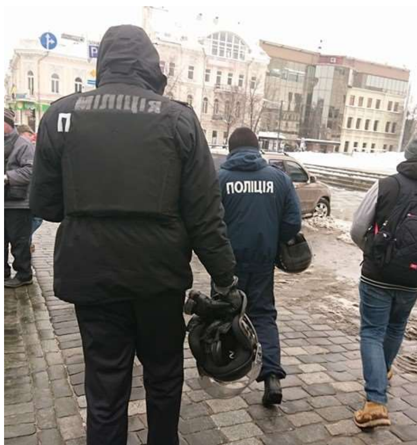
«Марш Жіночої Солідарності: Всі Різні, Всі Рівні» (Харків)