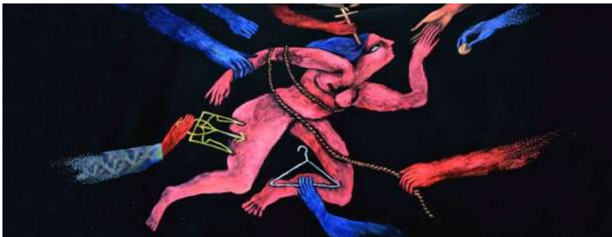
Банер, який був вирваний в учасників/ць «Маршу жінок [...]»