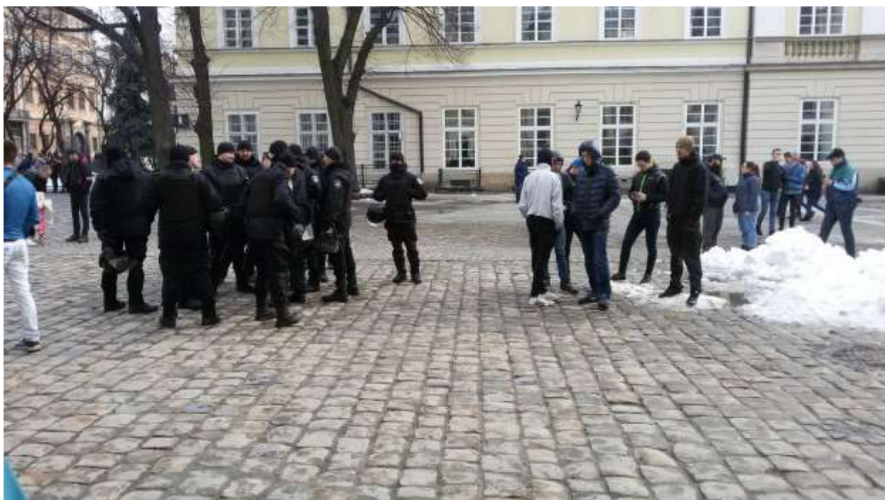
Марш «Сестринство, підтримка, солідарність» (Львів)