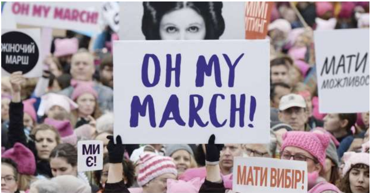
«Oh My March!» (Київ)