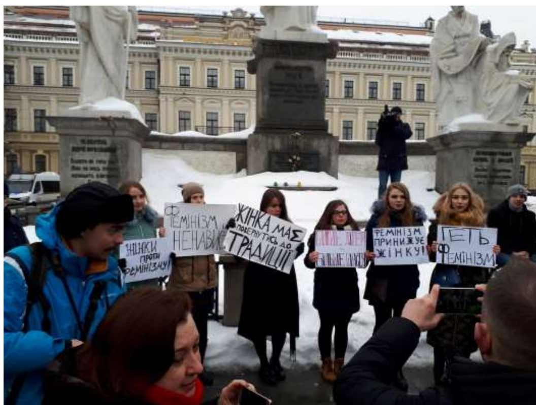
Контрзібрання проти «Маршу жінок 8 березня[...]