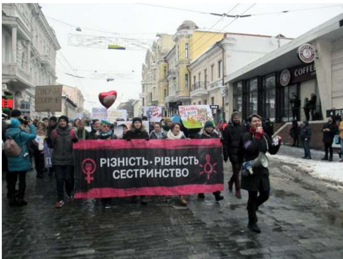
«Марш Жіночої Солідарності: Всі Різні, Всі Рівні» (Харків)