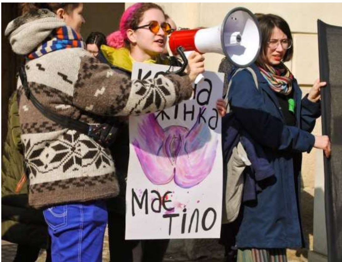
Плакат учасниці маршу у Львові, який правоохоронці просили забрати і не демонструвати.