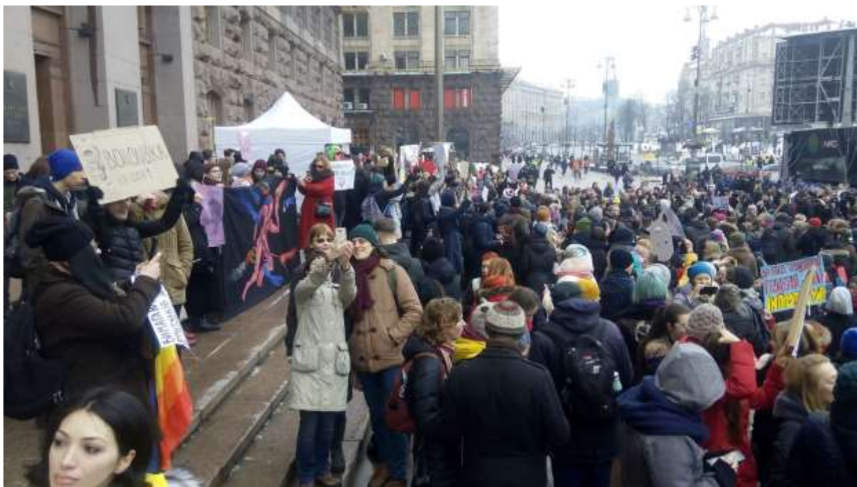
«Марш жінок 8 березня. Годі терпіти!» (Київ)