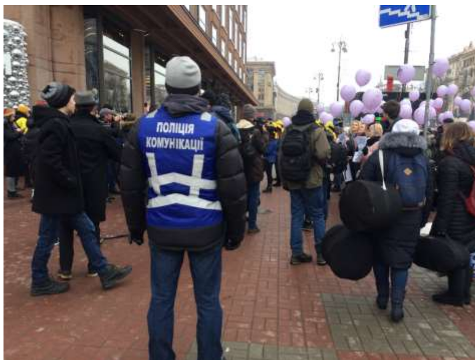
Марш «Oh my March!» (Київ)