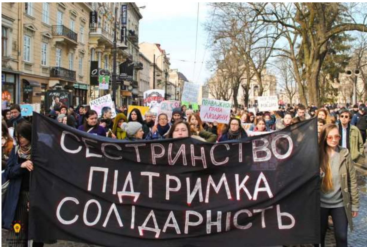
Марш «Сестринство, підтримка, солідарність» (Львів)