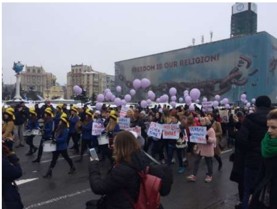
Марш «Oh my March!» (Київ)