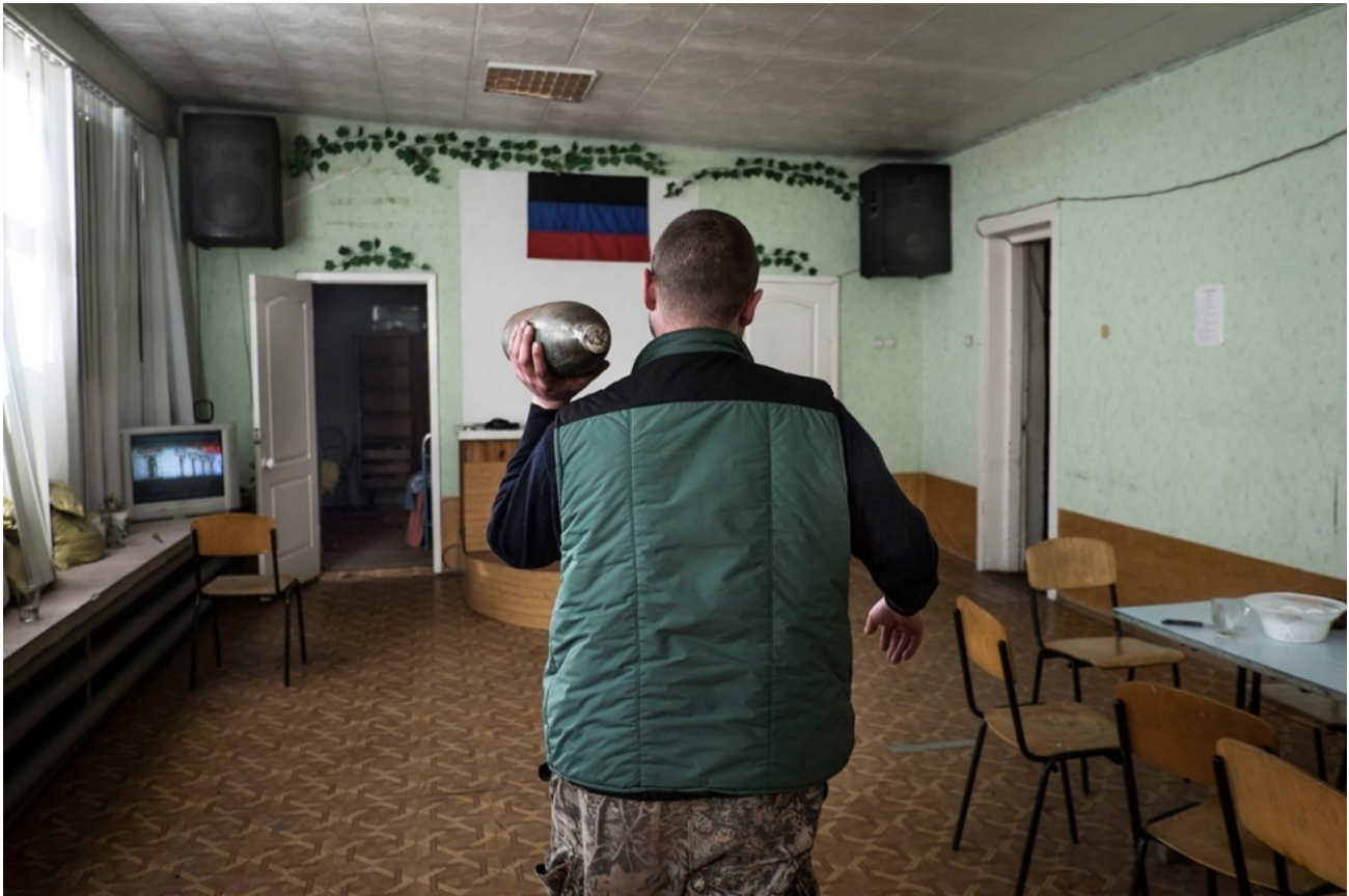
Боевик ДНР, несущий снаряд по помещению Церкви Христовой. Донецк, март 2015 года.

Другая группировка пророссийских боевиков заняла здание церкви в ноябре 2014 года, и по состоянию на март 2015 года здание использовалось как военный лагерь сепаратистов. 42 Со времени захвата здания Церкви Христовой около 100 её прихожан продолжают собираться в тайных местах, разбросанных по всему Донецку. Когда Крыжановского спросили, не боится ли он, что незаконные комбатанты запретят их Церкви собираться для молитвы по домам, он ответил: «Мы не боимся, ведь и первых христиан также преследовали. Но они не боялись проповедовать Иисуса Христа». 43