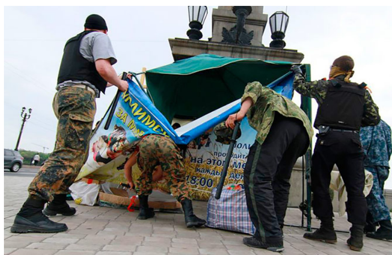
Пророссийские боевики разрушают палатку Молитвенного марафона на площади Конституции, май 2014