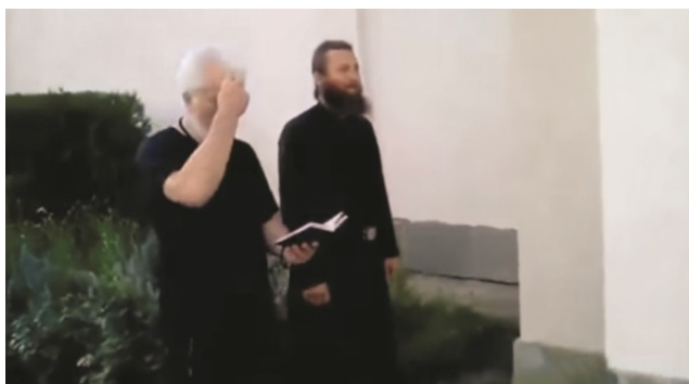
Кадры из видео, опубликованного незаконными пророссийскими боевиками. Стрельба из установки НОНА-С с территории Церкви «Добрая весть» (слева) и сопровождение этих действий молитвами православных священников (справа). Славянск, июнь 2014 года